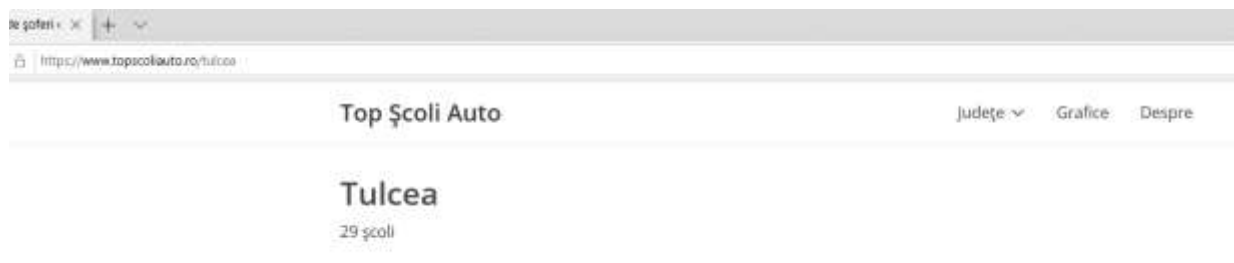
Figură 3.1 Reprezentare număr școli auto Tulcea

Conform datelor centralizate pe site-ul www.topscoliauto.ro în județul Tulcea piața acestor servicii include 29 de firme ce au asigurat un grad de promovabilitate